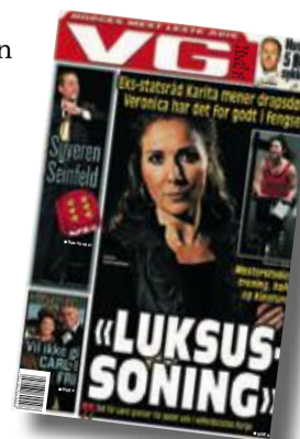
VG Søndag 5. juni

Og nylig ble Californias fengselsystem dømt av amerikansk høyesterett for å ha brutt det åttende tillegget i Bill of Rights, som forbyr «grusom og uvanlig straff», på grunnlag av overfylte fengsler. California har en fangebefolkning på 140 000 innsatte og er dømt av et kvasi-liberalt flertall av høyesterettsdommere til å redusere denne befolkningen