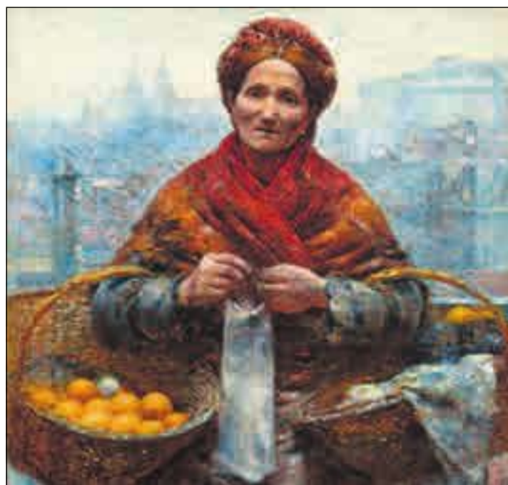
ARV OG MILJØ: Schama har malt et gnistrende portrett av jødisk kultur.

Det «jødiske spørsmål» (for å sitere tittelen på en av Marx' mer problematiske