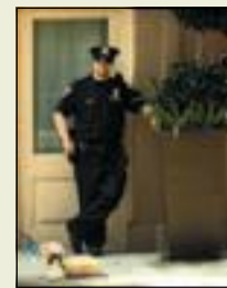
EKSPORT- VARE: Nulltoleranse- teorien.

Et eksperiment med 4.600 lavinntektsfamilier gjennomført av amerikanske myndigheter er den mest omfattende undersøkelsen av koplingen mellom uorden og alvorlig kriminalitet. Fattige familier fikk penger i hånden av staten til å flytte til mer velstående nabolag med lavere grad av uorden. Familiene ble verken mer eller mindre kriminelle av å bo i mer ordnede nabolag.