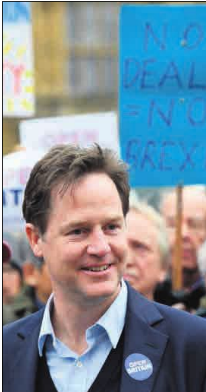
ET ANNET EU: Nick Clegg ser for seg et Storbritannia med en mer perifer tilknytning til EU.

Men Storbritannia bør kanskje gis anledning til å skifte mening. Etter hvert som det begynner å demre for britene at Brexit ble solgt inn på feil premisser – med færre arbeidsplasser og tilnærmet like høy innvandring som sannsynlige utfall – er det ingen skam å snu. Demokratiet er ikke statisk, men en