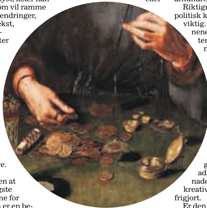
ILLUSTRASJON: QUENTIN MATS, 1514, WIKICOMMONS.

Victor Lund Shammas bokmagasinet@klassekampen.no