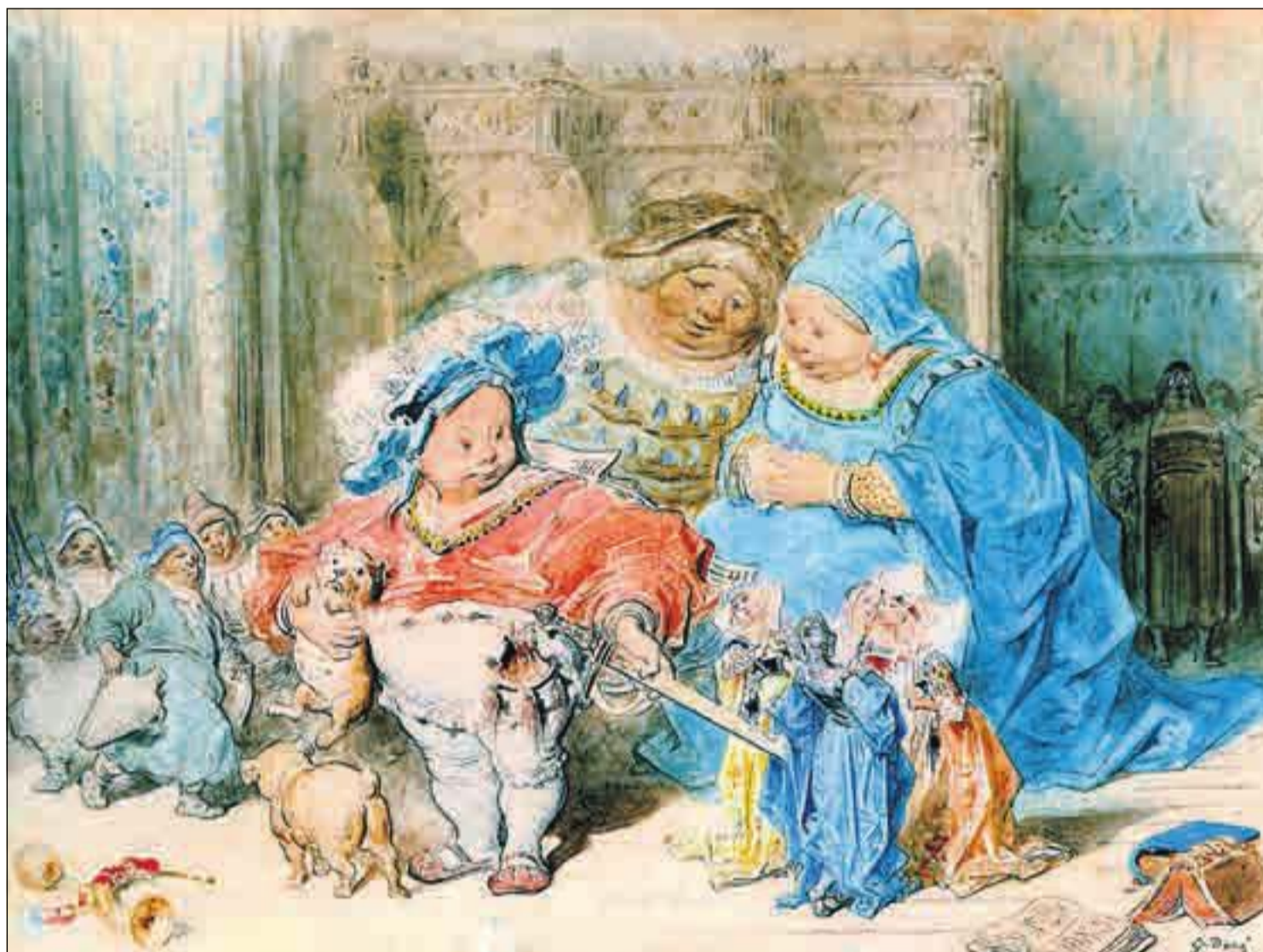
TABUBELAGT: De rike rettferdiggjør rikdommen sin ved å bruke sin frykt og angst strategisk.