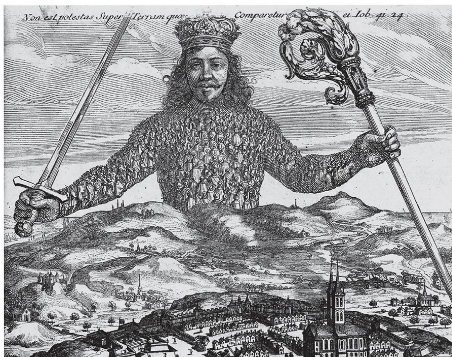
Fra Thomas Hobbes' (1651) Leviathan , der regenten holder et sverd i høyre hånd og en bispestav i venstre hånd. Staten forener det timelige og spirituelle, statens fysiske voldsmonopol og dens symbolske makt over sinnene, som Bourdieu understreker – en analogi til skillet mellom autoritet og omsorg.

Det å avdekke strukturelle homologier på tvers av domener (som i figur 10.1) er selvsagt ikke det samme som å etablere historisk kausalitet. Likevel er teologiske forestillinger om guddommelig straff og barmhjertighet på den ene siden og juridisk-sekulære tenkemåter og praksiser omkring statlig tvang og omsorg på den andre siden, nødvendigvis tett forbundet – ikke minst fordi det moderne fengselet oppsto ut av en kulturell og sosial kontekst som var gjennomtrukket av teologiske oppfatninger. Bibelen er en dialektisk tekst, organisert rundt motsetninger. Jesus instruerer sine følgere til å vende det andre kinnet til (Matt 5,39), men fremholder samtidig at han «ikke [er] kommet for å bringe fred, men sverd» (Matt 10,34). Disiplene skal være «kloke som slanger», men samtidig «troskyldige som duer» (Matt 10,16). En sentral spenning er motsetningen mellom dom – «Vi skal alle fram for Guds domstol» (Rom 14,10), som Paulus skriver – og barmhjertighet eller miskunn.